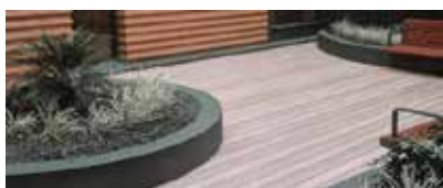
Arredo e Design