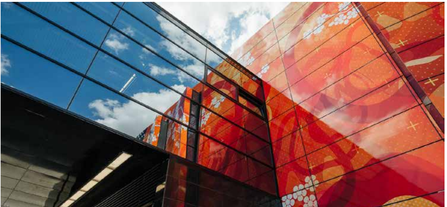
(Michurinsky Prospekt Metropolitana, Mosca)