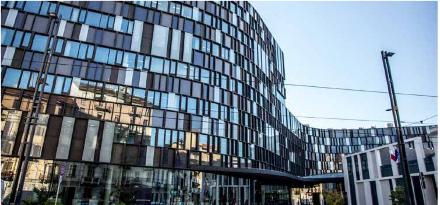
(Nuvola Lavazza, Torino)